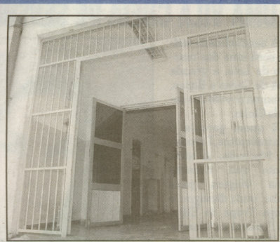
Os 28 detentos deixaram a unidade pela porta da frente