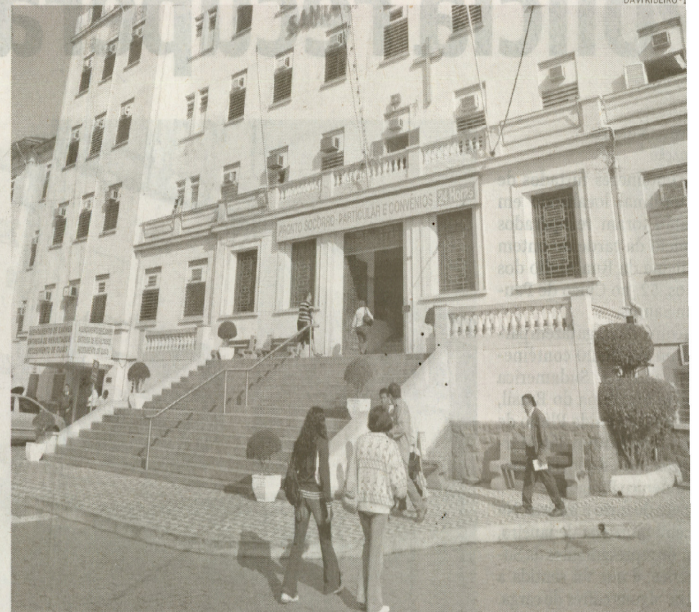
A previsão da Santa Casa é de que os dois pacientes com meningite deixem o hospital em 15 dias